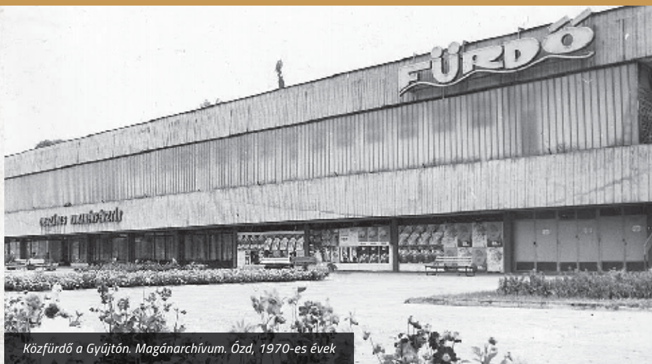
Közfürdő a Gyújtón. Ózd, 1970-es évek

A már 1970-ben is az úszás fellegváraként emlegetett Ózdon országos hír volt két évvel korábban, hogy „fürdőkombinát” épül. Miután a gyár területén lévő régi uszoda nem felelt meg a követelményeknek (habár később is tovább működött), 1968-ban szakaszos építkezési rendszerben készült egy új közfürdő és uszoda kivitelezési terve.