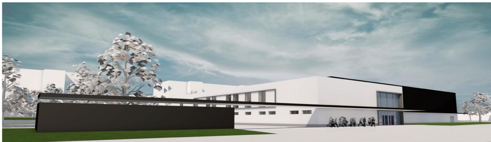
ÉSZAKI TÖMEGVÁZLAT, BEJÁRATI FRONT