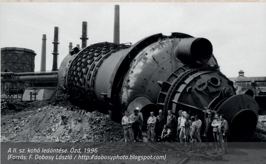
A II. sz. kohó ledöntése. Ózd, 1996

F. Dobosy László volt múzeumigazgató – édesapja mellett kezdve a fotózást – számos korabeli felvételt készített a rendszerváltás éveiben. A kohóbontásról, az egykori létesítmények eltűnéséről készült képei a gazdasági szerkezetváltás és az ipari örökség folyamatos romlásának keserű emlékei, forrásértékük több a pusztá illusztrációnál. A Magyarországon számos problémával szembenéző ipari örökségvédelem – más helyszínekhez hasonlóan – Ózdon sem tudta