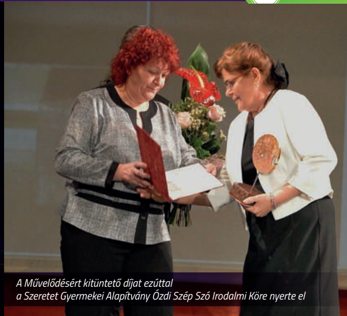
A Művelődésért kitüntető díjat ezúttal a Szeretet Gyermekai Alapítvány Ózdi Szép Szó Irodalmi Köre nyerte el

És hogy kultúránk nem ér véget a törzsnél? Ahogyan a fa lombkoronája szerteágazik, úgy a kultúrának is megannyi ága, számtalan kiteljesedése van a zenétől az irodalom, a festészet, a szobrászaton át a színházig, a filmig és tovább. És amilyen messzire elérnek a fa ágai, úgy a magyar kultúra is átszövi az egész világot. Trianon után a határokat átrajzolták ugyan, de azokon túl is ápolják még a népi hagyományokat. Éppúgy az egykori magyar területeken, ahogyan akár a tengerentúlon, az odáig elszármazott hazánkfiak. Örömmel és szeretettel fogadják azt, aki kultúránk egy-egy szeletét elviszi nekik: legyen az egy szép nóta vagy egy verbunkos. Ugye, milyen érdekes: verbunkos – német szó, de magyar tánc.