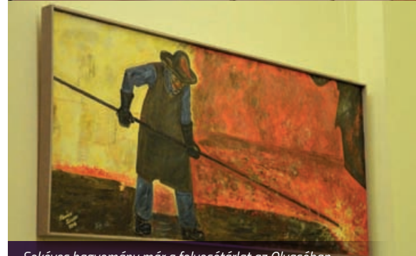
Sokéves hagyomány már a folyosótárlat az Olvasóban