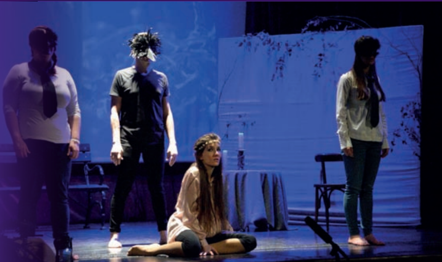
Pilinszky versét és a Képzelt riport egy amerikai popfesztiválról dalait dolgozta fel A madár és a lány című zenés versszínházi előadás