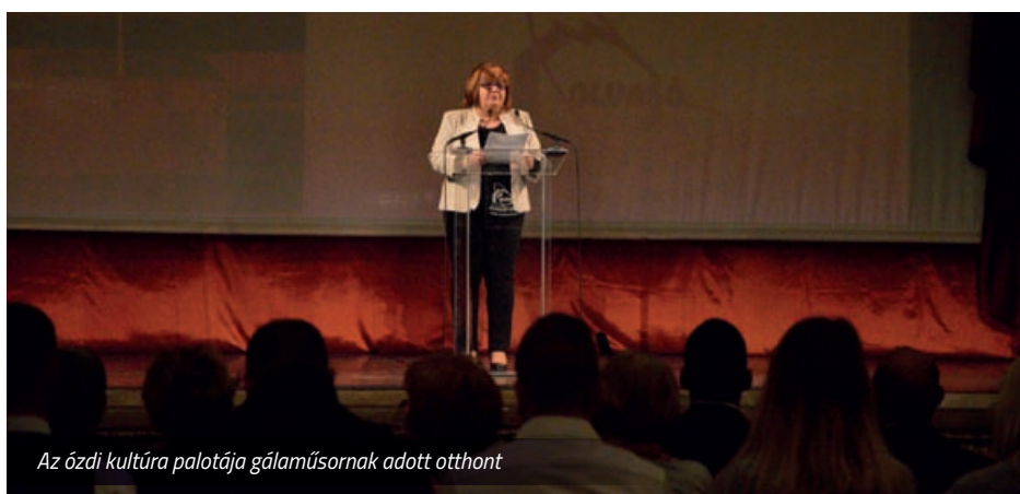
Az ózdi kultúra palotája gálaműsornak adott otthont

hányan értik meg mifelénk, mit csinál az, aki hömbölködik? Ezt a színes, szerteágazó sokféleséget a mi feladatunk megőrizni, ne féljünk hát saját nyelvünket választékosan használni.