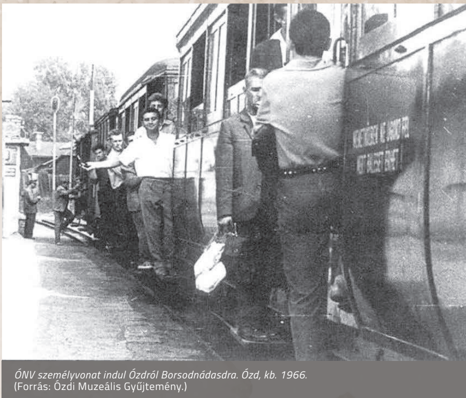
ÖNV személyvonat indul Ózdról Borsodnádásdra. Ózd, kb. 1966.