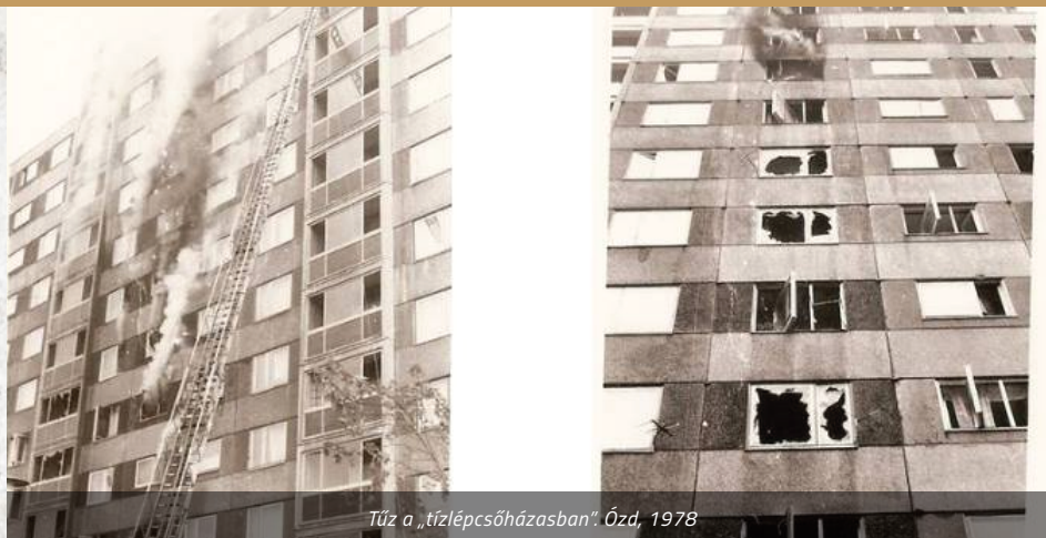
Tűz a „tízlépcsőházásban”. Ózd, 1978

A városközpont I/A jelű, akkori „újabb” nevén Vörös Hadsereg út 80. szám alatti tízzintes, tízlépcsőházas házigyári panelépületéhez riasztották a tűzoltókat 1978. október 31-én, 10 óra 4 perckor. Az Ózdi Vasas korabeli tudósítása szerint a 2. lépcsőház 1. emeleti egyik lakásában észlelték a tüzet, amely gyorsan terjedni kezdett felfelé és a tűzoltók kiérkezésekor már a 3. és 4. emeleti lakások ablakiból is lángok csaptak fel.